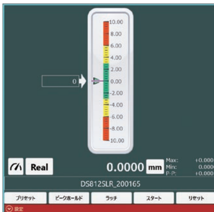
縦型バーグラフ表示