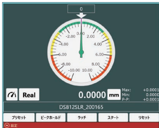
アナログメータ表示