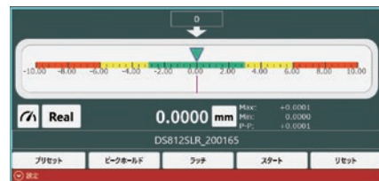
横型バーグラフ表示