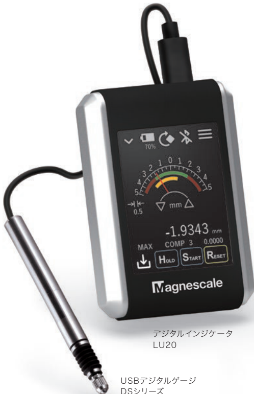
デジタルインジケータ LU20