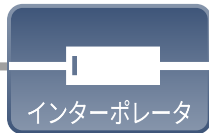
インターポレータ MJ100/MJ110