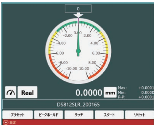
アナログメータ表示